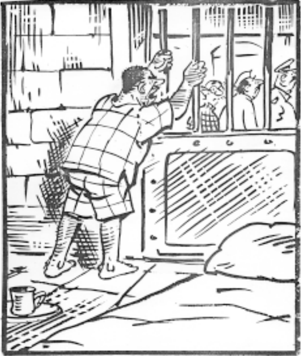
నా బెయిలు సంగతేమిటి? నేను జేబు దొంగను మాత్రమే!