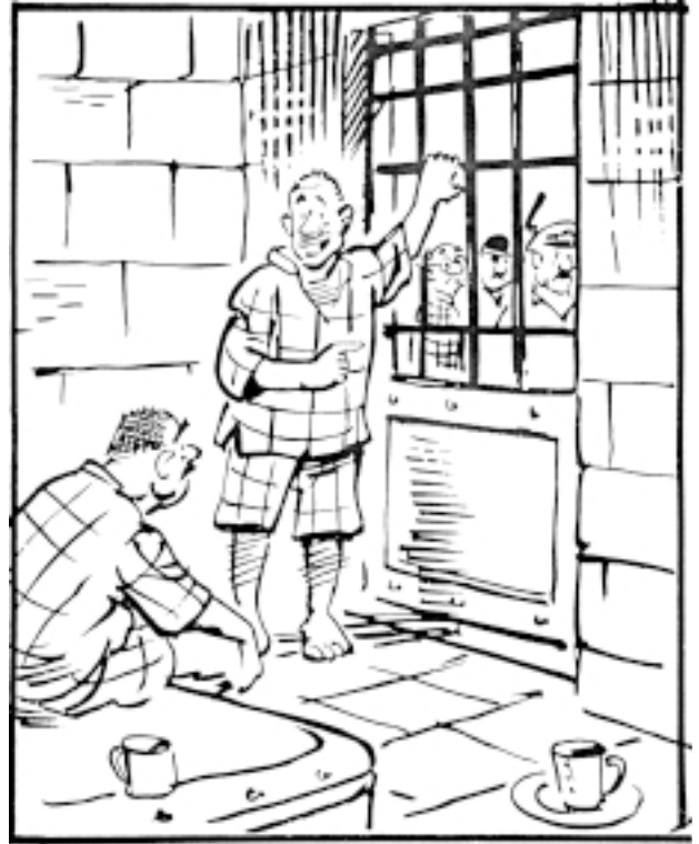
పక్క గదిలో ఫ్రీజ్, ఏసి, సోఫాసెట్, కార్పెట్ ఏర్పాటుచేస్తున్నారు. ఎవరో గొప్పవాళ్ళు వస్తున్నారనుకుంటాను!