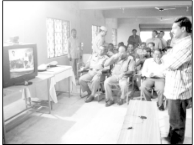
వీడియో అనుసంధాన విధానం, హైదరాబాద్ కేంద్ర కారాగారం

పరిమితమైన ఇంటర్వ్యూ సమయాలలోనే ఆ ప్రయత్నం చేయాల్సి రావడం ఖైదీలకు సమస్యగా మారుతోంది. వీడియో అనుసంధానం ఏర్పాటు తర్వాత, విచారణ ఖైదీలకు బయటి ప్రపంచంతో సంబంధాలు పూర్తిగా తెగిపోతున్నాయి. దాంతో వారికి, శిక్షపడిన ఖైదీలకు మధ్య ఉన్న సన్నని విభజన రేఖ పూర్తిగా తుడిచి పెట్టుకుపోతోంది. అంతేకాక, వీడియో అనుసంధాన గదిలో జైలు అధికారుల సమక్షంలోనే ఖైదీలు మాట్లాడాల్సి రావడంతో, జైళ్ళలోని సమస్యలను, విచారణ ఖైదీలు - ముఖ్యంగా దీర్ఘకాలం ఉన్నవారు - న్యాయమూర్తి దృష్టికి తేలేకపోతున్నారు. వీడియో అనుసంధాన విధానంలోని లోపాలను సరిదిద్దకపోతే, విచారణ ఖైదీల సమస్యలు మరింత జరిలమయ్యే అవకాశం ఉంది.