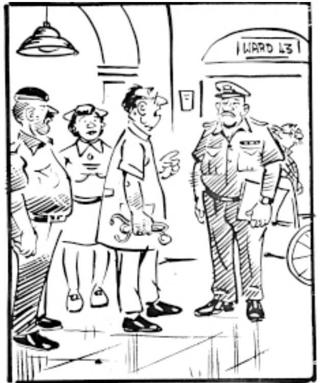
అతనికి నిజంగానే గుండెనొప్పి ఉందని వైద్యపరీక్షలన్నీ చెబుతున్నాయి. బహుశా అతను నిజంగానే అమాయకుడేమో!

ఖైదీల వైద్యసౌకర్యం హక్కుకు గుర్తింపుగా, మహారాష్ట్రలోని నాసిక్ జైలులో విచారణలో ఉన్న ఒక ఖైదీ వైద్య సౌకర్యం లేక మరణిస్తే, అతని మీద ఆధారపడిన వారికి లక్ష రూపాయలు చెల్లించాలని జాతీయ మానవ హక్కుల సంఘం ఆ రాష్ట్ర