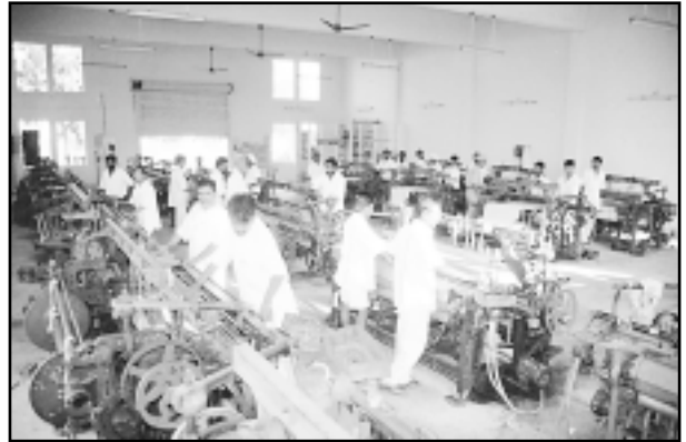
కర్మాగారంలో పని చేస్తున్న ఖైదీలు, చర్లపల్లి కేంద్ర కారాగారం, హైదరాబాద్

“ఖైదీకి కఠిన కారాగార శిక్ష విధించడమంటే ఎక్కువ శ్రమ చేయించాలనో, కఠినమైన శ్రమ చేయించాలనో కాదు” అని సునీల్ బాత్రా II వర్సెస్ ఢిల్లీ అడ్మినిస్ట్రేషన్ తీర్పులో సుప్రీంకోర్టు అనింది. ప్రతీకారంతో ప్రవర్తించే అధికారి ఖైదీని కఠినమైన, అవమానకరమైన శ్రమకు గురిచేస్తే పైన పేర్కొన్న తీర్పును ఉల్లంఘించినట్లే.